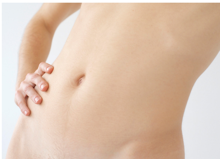
© Patrick Rimond - janvier 2018

Ses photographies ont donné lieu à la publication de cinq livres monographiques dont QASD 2019, Hudros 2016 (éd. Iki) et PORTRAITS (éd. Presses de l'ENSTA) 2009. Son travail est régulièrement exposé - galerie Nadar, Tourcoing, galerie Sophie Leiser, Paris, Les Promenades Photographiques, Vendôme, MABA, Nogent-sur-Marne, galerie Lab Artyfact Paris, galerie Dufay-Bonnet, Paris, Musée d'Histoire de la Photographie, Cracovie, Plateforme, Paris, galerie KHI5, Berlin.