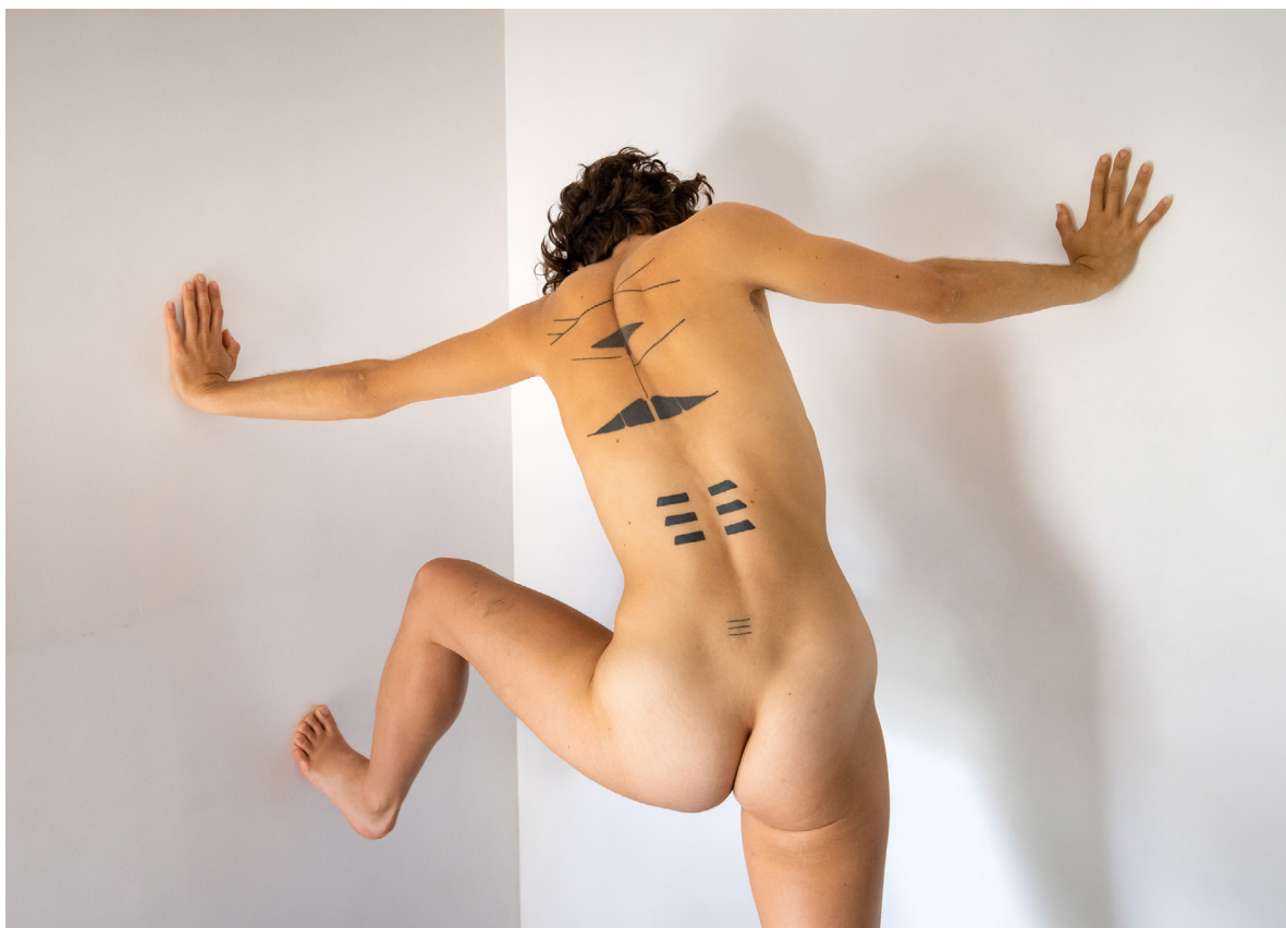
© Patrick Rimond - septembre 2019

L'Escalier est un collectif de 2 artistes, Patrick Rimond et Jolanta Anton , un espace d'exposition et un atelier de gravure à Auxerre.